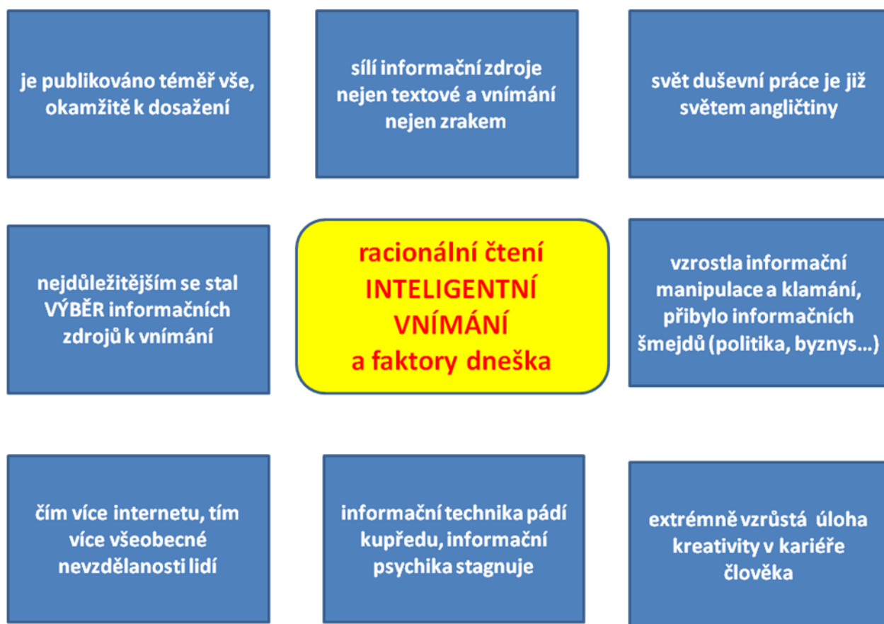
Schéma 1 – Faktory, kterým se dnes musí přizpůsobit rychločtení, racionální čtení, inteligentní vnímání

Zopakujme si spolu hlavní odlišnosti dneška oproti předinternetové době a podívejme se, jak na to reaguje vývoj tohoto know-how. Přehledně je ukazuje Schéma 1, podrobnější popis bude následovat.